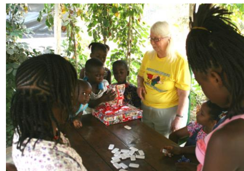
Gun får glädjen att dela ut paket

Vi hade fått med oss en massa ”julklappar” så de blev till stor glädje för många.