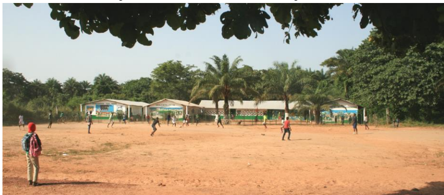
Skolan i Cacine med fotbollsplanen