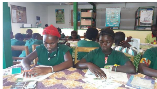
Elever som studerar i biblioteket