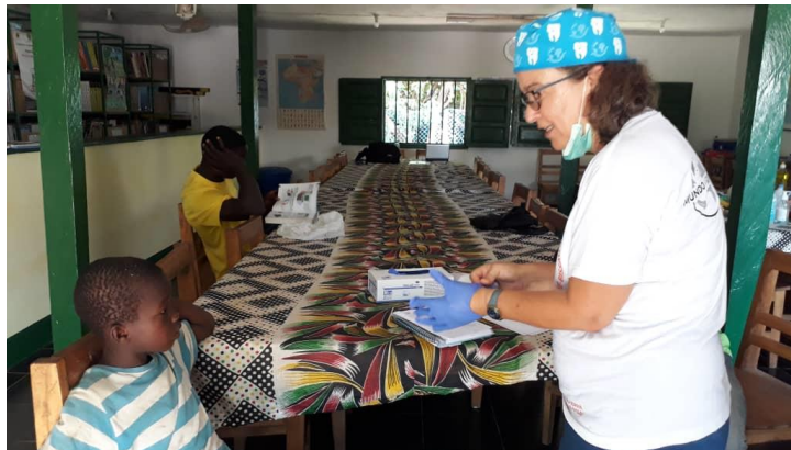
Tandläkarna i full i verksamhet i biblioteket

Under hösten blev Valberto erbjuden besök av portugisiska tandläkare. De kollade tandstatus och gjorde en del lagningar. Barnen fick också lära sig att borsta tänderna.