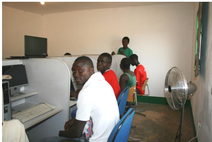
Elever vid sina datorer i IT-salen

De läsplattor och två ”stationer” med Wikipedia som vi tog med tidigare till biblioteket och IT-undervisningen, kunde vi nu uppdatera med den senaste versionen på portugisiska. Ännu finns ju ingen internetuppkoppling. Vi besökte radiostationen som sänder varje dag i tre timmar på creol, susu och nalu och når ut till 100.000 människor. Även i Guinea-Conacry (grannlandet) finns lyssnare.