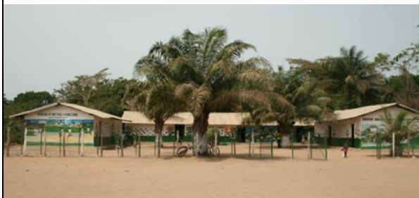
Skolan i Cacine