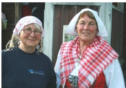
Pigan Gun och Land Alice