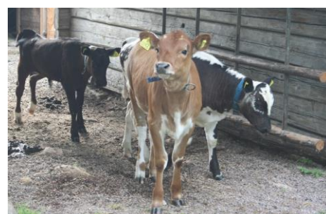
Kalvarna släpps ut på bete.