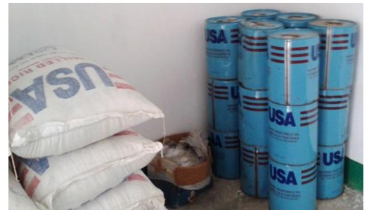
Matförråd med ris och olja

Valberto hälsar och tackar för all hjälp och stöd till verksamheten. Det känns uppmuntrande för framtiden!