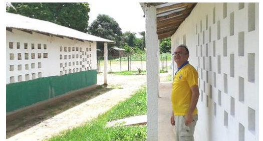
Nya skohuset till höger

arbetstimmar vid de uppresta lerväggarna. I anslutning till skolsalarna finns nu även ett läkemedelsförråd för skolan och ett förråd för ris, bönor och matolja.