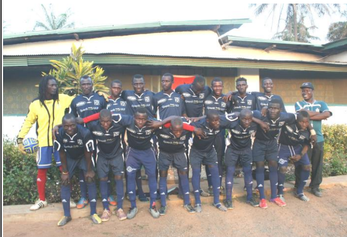
Fotbollslaget i Cacine i sina nya fina kläder!

Inte bara fotbollslaget, utan hela byn glädde sej över kläderna. Det var folkfest! Nu är det bara fotbollsskor som saknas (se bilden med platsandalerna). Laget hoppas nu kunna få spela i en högre division. Vi från Zlatans hemland önskade dem lycka till!!