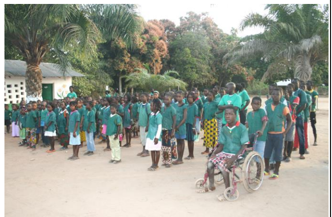
Eleverna på Escola Betél hälsade oss välkomna på tisdagsmorgonen