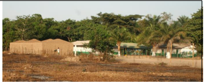
Nya skolbyggnaden till vänster

Varje gång vi kommer blir vi positivt överraskade. Den här gången hade skolan byggts ut med en sjukvårdsklinik och ytterligare en byggnad med två klassrum och ett förråd. På skolan har grönsaksodlingen kommit igång och det ger ett bra näringstillskott till skolmaten. Eleverna får lära sig trädgårdsskötsel också. Skolan har utökats till nästan 600 elever!