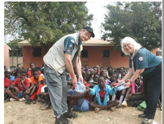
Svenska och guineanska scoutledare